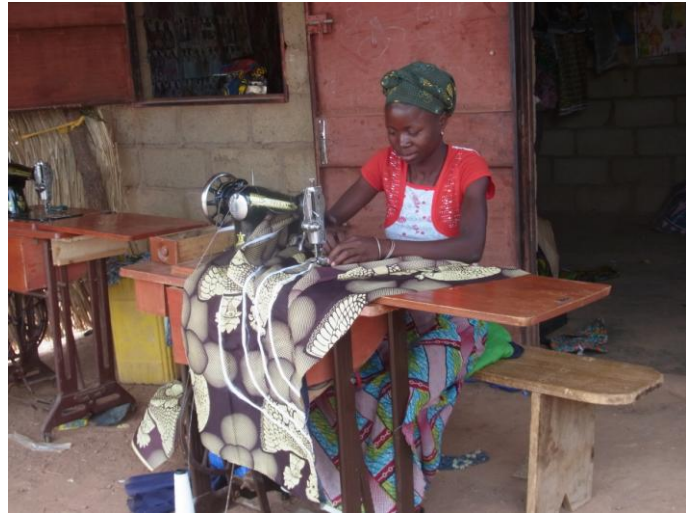
...sind in Boumdoudoum genäht worden.